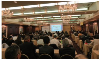
第10回 屋上緑化講演会(平成31年:大阪)