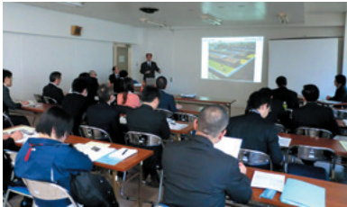
地方自治体様への説明会 (平成24年:千葉)