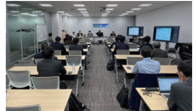
第12回屋上緑化講演会 (令和4年:WEB)