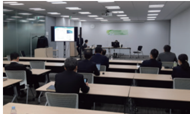
第11回屋上緑化講演会 (令和2年:WEB)